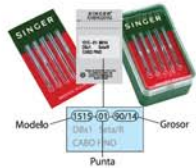
TABLA DE EQUIVALENCIAS DE GROSOR